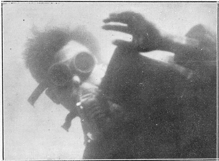
Le Sous-Marin Blessé

Un navire a heurté le submersible, qui coule à pic, et c'est alors, dans toute