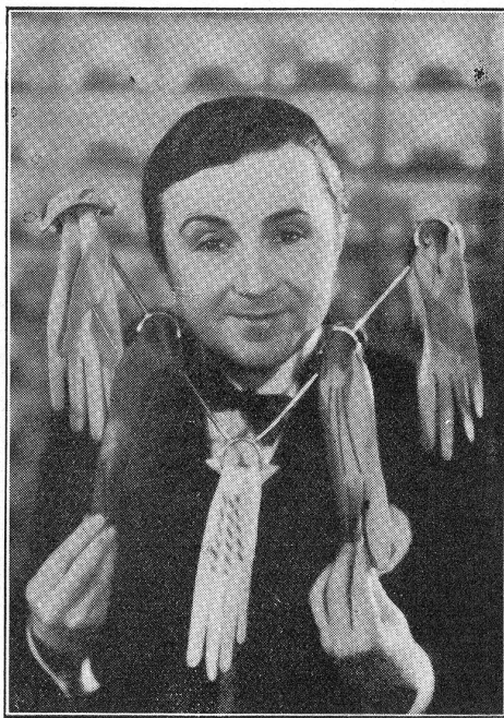
Noël-Noël dans Mannequins