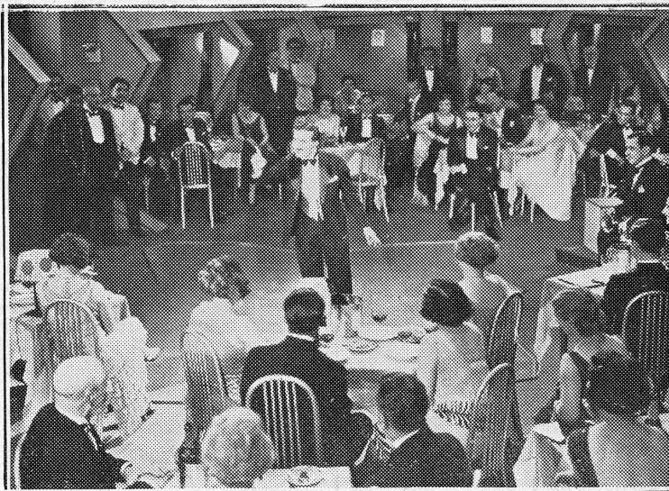
Victor Boucher dans La Douceur d'Aimer .