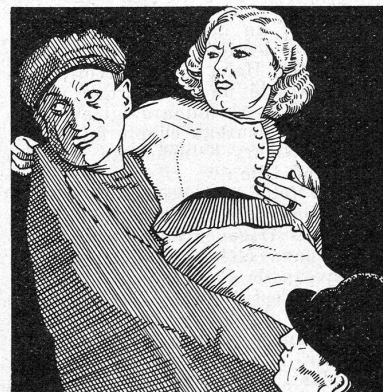
Le Dernier Choc.