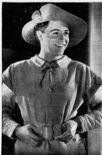
Willy Fritsch im Ufa-Grossfilm «Turandot».