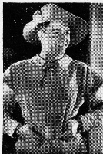
Willy Fritsch im Ufa-Grossfilm «Turandot».

Die Ufa wird im Rahmen ihres diesjährigen Produktions-Programms einen grossen Tonfilm vom Leben und Sterben der Jeanne d'Arc drehen. Das Manuskript zu dem neuen grossen Film