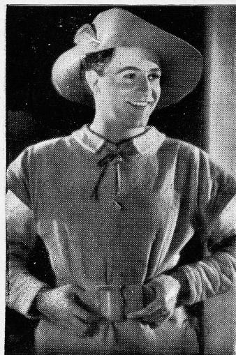
Willy Fritsch im Ufa-Grossfilm «Turandot».

Die Ufa dreht «Johanna von Orleans»-Film. Die Ufa wird im Rahmen ihres diesjährigen Produktions-Programms einen grossen Tonfilm vom Leben und Sterben der Jeanne d'Arc drehen. Das Manuskript zu dem neuen grossen Film