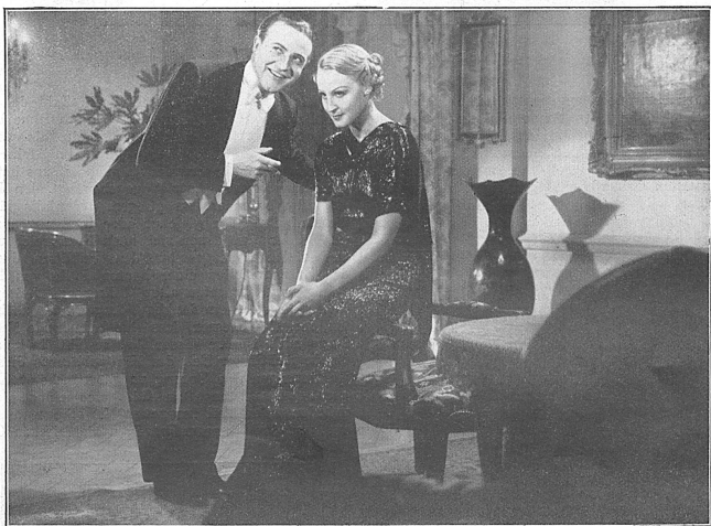
Brigitte Helm und Willy Fritsch in dem grossen Ufa-Film Die Insel .