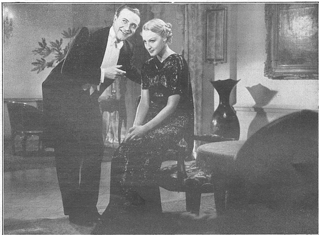
Brigitte Helm und Willy Fritsch in dem grossen Ufa-Film Die Insel .

« Da stimmt was nicht », ein Lustspiel Film unter der Regie von H. H. Zerlett mit Viktor de Kowa, Lizzi Holzschuh, R. A. Roberts, Elga Brink, Adele Sandrock und Paul Heidemann. Die Musik liefert der Komponist Eduard Künnecke. Weltvertrieb : Centropa-Film.