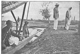
Gustav Diessl, der Hauptdarsteller des auf der Internationalen Himalaya-Expedition 1934 aufgenommenen Spielfilms, in einer Szene mit einem Hindu-Mädchen.

Vor allem muss man sich natürlich darüber klar sein, ob man von einer solchen Expedition einen reinen Reportage- (Kultur-) oder einen Spielfilm nach Hause bringen will. Selbst dabei schwanken viele Expeditionenleiter bis zum Schluss, und so wurde denn oft der Versuch gemacht, nach Rückkehr der Expedition einen Kul-