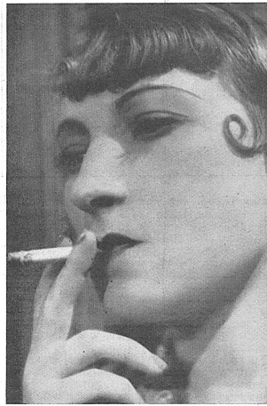
Orane Demazis, la célèbre Fanny, dans «Angèle». Un film de Marcel Pagnol.

— Verlängerung der Nachlassstundung Prorogation du sursis concordataire Ct. de Berne. — Arrondissement de Porrentruy. Par ordonnance du 11 septembre 1934, le pré-