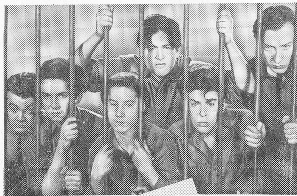
Les 6 gosses jouant dans «L'Ecole du Crimes»

derlassen, während Cinecolor eine neue Kopieranstalt errichtet und Cinecolor seine Werkanlagen vergrößert, nachdem die Aufträge für diese Firma durch die Paramount sich im letzten Jahre verdoppelt haben. Die Umsätze aller großen Farbfilm-Firmen haben sich stark vergrößert.