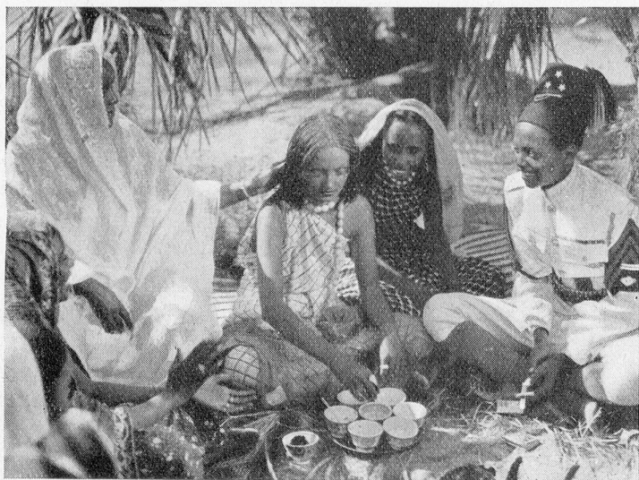
Szenenbild aus dem großen Kolonialfilm «Die schwarze Wacht». Verleih: Sefi, Lugano

Anfragen, die mit diesem Wettbewerb zusammenhängen, werden nicht beantwortet.