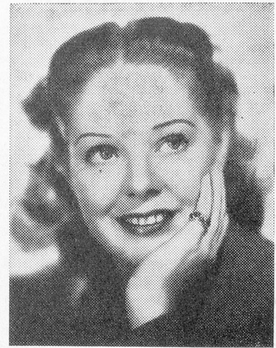
Alice Faye spielt im neuen 20th Century-Fox-Film « Chicago in Flammen ».