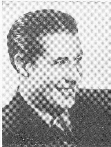
Don Ameche sehen wir im neuen 20th Century-Fox-Film « Chicago in Flammen ».

Parmi les films qu'on tourne à l'heure actuelle, il faut mentionner particulièrement « Les Gens du Voyage », de Jacques Feyder, avec Françoise Rosay et bien des