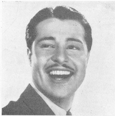
Don Ameche, Vedette. 20th Century-Fox.

Dem Ruhm der Flugwaffe gilt ein amerikanischer Farbenfilm «Men with Wings» von William A. Wellman (Paramount), der hier in französischer Version unter dem Titel «Les Hommes Volants» läuft. Motiv der Handlung ist die Entwicklung des Flugwesens in den Vereinigten Staaten seit den ersten Versuchen der Brüder Wright im Jahre 1903, und der Anteil Amerikas an der Eroberung der Luft. Leider ist dieses Thema etwas summarisch behandelt, der fesselnde Kulturfilm mit einem üblichen und oft sehr primitiven Roman verkettet. Der Wert des Films sind seine kühnen und atemraubenden Flugszenen, eine neue Probe der fabelhaften Leistungen der amerikanischen Piloten; nicht minder gelungen sind auch die hübschen Aufnahmen der Flugversuche dreier Kinder, die es den Großen nachtun wollen. Fred Mac Murray , Ray Milland , Louise Campbell und der lustige Andy Devine spielen die Hauptpartien, unterstützt von den zahlreichen Fliegern der Armee. Als Farbenfilm stellt diese Arbeit zweifellos einen wesentlichen Fortschritt dar, dank des Technicolor-Verfahrens sind hier einige sehr schöne Tönungen vom Himmel, Meer und Wolken gelungen, von denen sich die Flugzeuge außerordentlich plastisch abheben; und doch kann man sich nicht ganz des Eindrucks erwehren, daß man keinen Film, sondern eher ein koloriertes Bilderbuch sieht. Auch hier trug die Premiere, deren Erlös für wohltätige