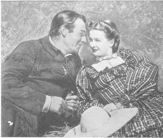
Randolph Scott und Joan Bennett in einer Szene aus der deutschsprachigen Paramount-Produktion «Ueber die Grenze entkommen». Verleih: Eos-Film A.-G., Basel.

fernerhin 75 Centimeter breit sein; das ist gerade die Breite von einem sehr breiten Leder- oder Clubfauteuil!