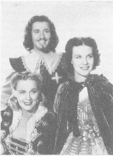
Don Ameche (D'Artagnan), Pauline Moore (Constance), Gloria Stuart (La Reine) dans «Les trois Loufs... Quetaires» (The Three Musketeers). 20th Century-Fox.

sene Land einen Vertreter entsendet; den Vorsitz führt der Präsident des Internationalen Katholischen Filmbüros. Das Ehrenkomitee umfaßt zahlreiche geistliche und weltliche Persönlichkeiten von Ruf. Ein technischer Ausschuß wird in zweiter Lesung endgültig über die von den nationalen Stellen vorgelegten Manuskripte entscheiden. Das Sekretariat befindet sich: 29, rue d'Artois, Paris 8 o .