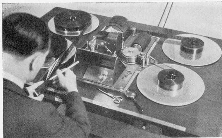
Tonschneidetisch. — Arbeitsvorgang: Synchronanlagen eines getrennten Bild- und Tonbandes. Turicia-Film A.G.

schmelzenden Schnee» besichtigt. Auch hier konnten wir stets eine helle Begeisterung des Publikums bestätigt bekommen.