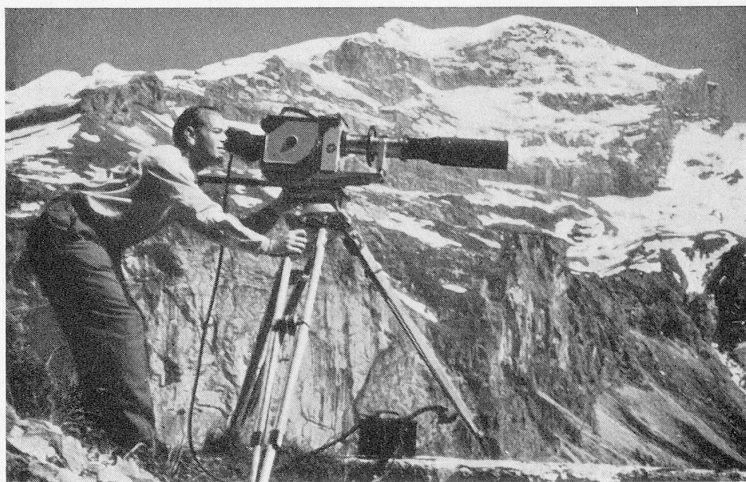
Arbeit im Hochgebirge mit der Fernbildlinse 400 mm.

Die Landesausstellung war von uns mit dem fünfteiligen Dokumentarfilm «Lebendige Schule» und im Verkehrspavillon u. a. mit dem Kultur-Tonfilm «Alpenblumen im