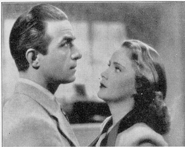
Sehend geworden durch Blindheit?

Die Scalera Film hat neuerdings die berühmte Viviane Romance verpflichtet. Sie wird die Hauptrolle in dem großangelegten Film «Carmen» spielen, der unter der Leitung von Christian Jaques in Rom in Angriff genommen wurde. Somit erlebt eine der bekanntesten und spannendsten Liebesgeschichten ihre Neuverfilmung: Die Geschichte der Carmen, die den Namen zweier großen Autoren volkstümlich gemacht hat, den Schriftsteller Prosper Mérimée und den Musiker George Bizet. Die musikalische Untermalung besteht aus den schönsten Melodien und Arien der bekannten Oper von Bizet. Viviane Romance äußerte sich gegenüber einem Journalist in Bezug auf ihre Filmarbeit wie folgt: «Seit jeher war es mein größter Wunsch, die «Carmen» filmisch gestalten zu können. Nun geht mein langsehnter Wunsch in Erfüllung. Bereits vor Ausbruch des Krieges wurde ich von der Scalera Film in Rom für die Darstellung der Carmen verpflichtet. Eine Zeitlang hat der Krieg das Vorhaben vereitelt und nun geht der lang vorbereitete Plan seiner Verwirklichung entgegen. Ich bin schon so tief in den Charakter der Carmen eingedrungen, daß es mir ist, als wäre ich eins mit ihr.»