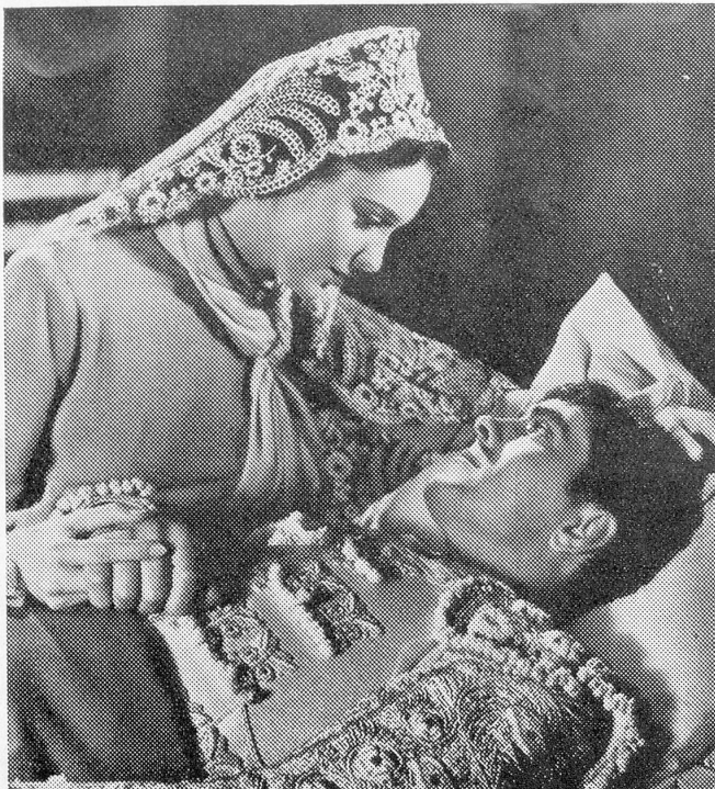
Szene aus dem herrlichen Farbenfilm «Blutiger Sand» der 20th Century-Fox Corp.