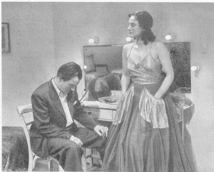
«Sein letztes Lied»