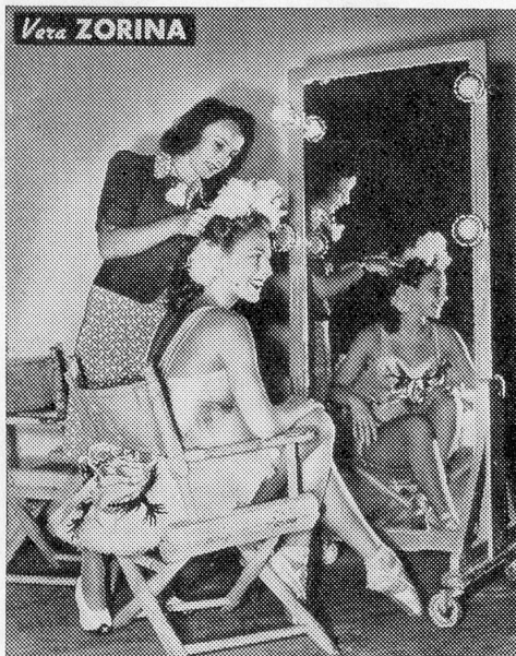
Vera Zorina die bekannte russische Tänzerin, die wir bereits in « Goldwyn Follies » bewunderten, ist jetzt von Paramount engagiert worden. Ihr erster Film heißt « Louisiana Nächte ». Das Bild zeigt, wie Zorina für eine der großen Revueaufnahmen zurecht gemacht wird.