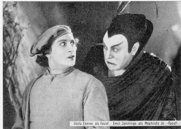
Gösta Ekman als Faust, Emil Jannings als Mephisto in «Faust»