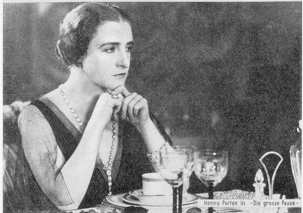
Henny Porten in «Die grosse Pause»