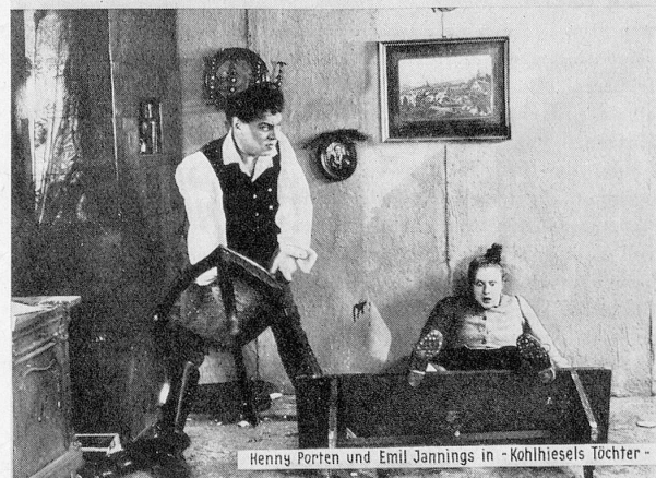
Henny Porten und Emil Jannings in «Kohlhiesels Töchter»