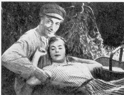
Scena aus «Die Frau der Brüder».