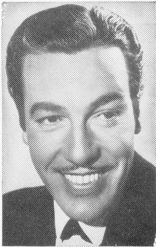
Cesar Romero in «Hello America» der 20th Century-Fox

schnürt und Tränen treibt, stelle ihn als wahrhaft großen Kriminalfilm von seltener Schönheit und als Zeitdokument hin. Damit hast du gar nicht so unrecht, denn es ist ein Dokument für den Geist in dir. Hebe hervor die Abenteuer von nie erreichter Spannung, die barbarisch und geheimnisvoll sind, sie wirken faszinierend, besonders der Todessprung aus gewaltigem, rauhem Hintergrund. Die Streiche und Zechgelage, bei denen der Bandit tüchtig in Wein, Weibern und Gesang als Desparado mit dynamischer Wucht aus der Unterwelt in unser sündiges Jahrzehnt frisch, frech und unbekümmert und in unsere von menschlichen Schwächen, Enttäuschungen erfüllte Welt tritt, wird brausendes Gelächter auslösen.