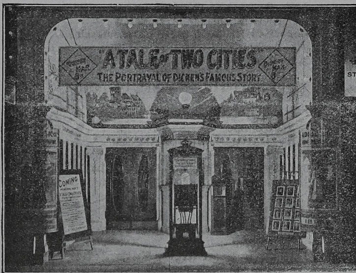
Eingang eines amerikanischen Kinos, wo der Gleichrichter zu Reklamezwecken verwendet wird.