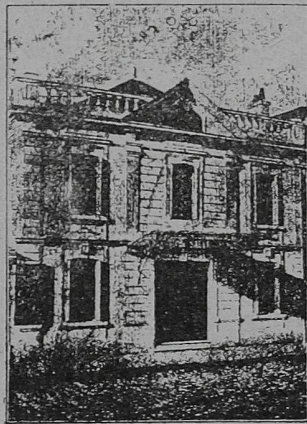
DIRECTEUR : E. LASNIER

SALLE de FÊTES avec SCÈNE et DÉCORS Pour Concerts, Représentations Théâtrales, Soirées de Sociétés, de Familles, etc.