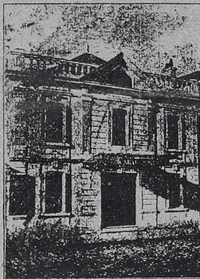
DIRECTEUR : E. LASNIER