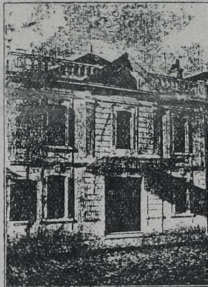
DIRECTEUR : E. LASNIER