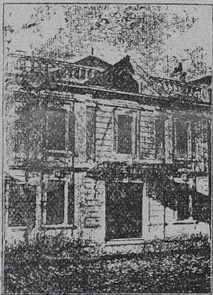
DIRECTEUR : E. LASNIER