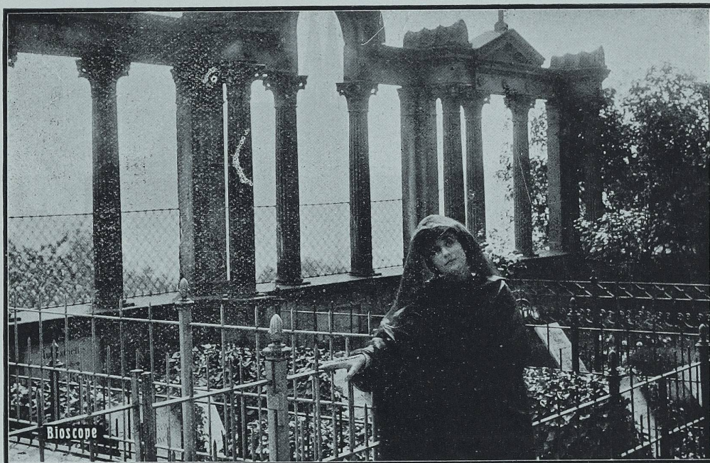
Maria Carmi als trauernde Gattin und Mutter