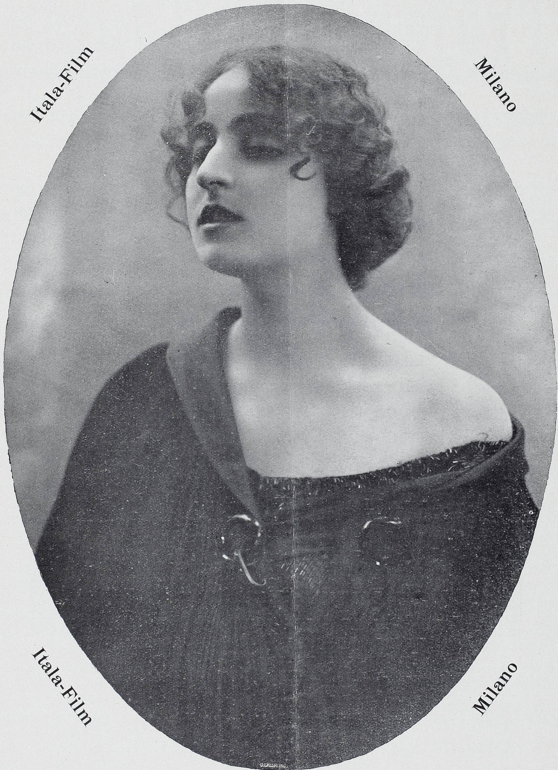
Frl. Pina Menichelli die Königin des Kino