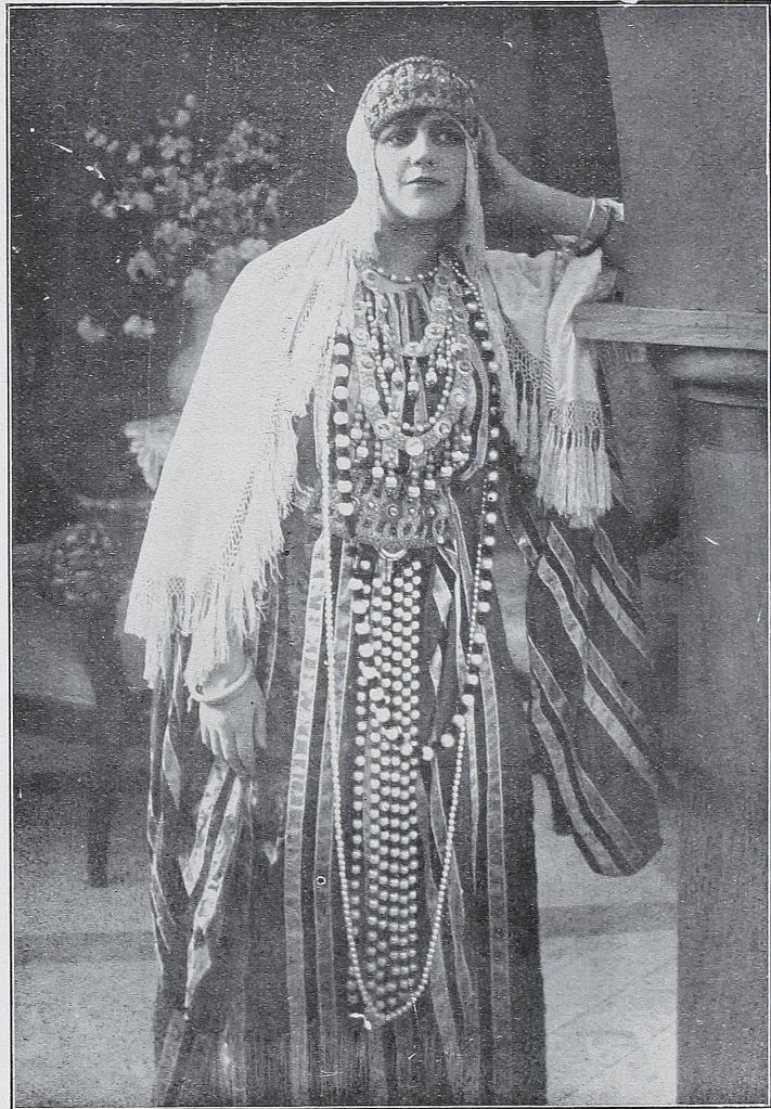
Hauptdarstellerin Ellen Richter