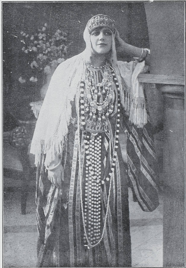
Hauptdarstellerin Ellen Richter