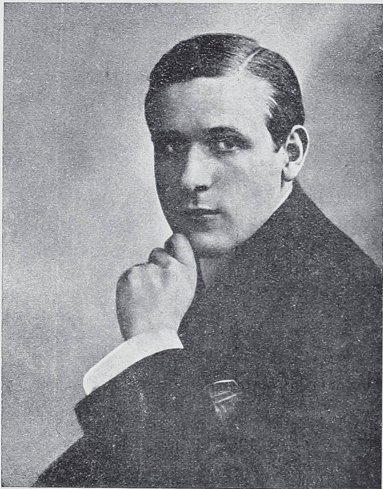
Regisseur Richard Eichberg