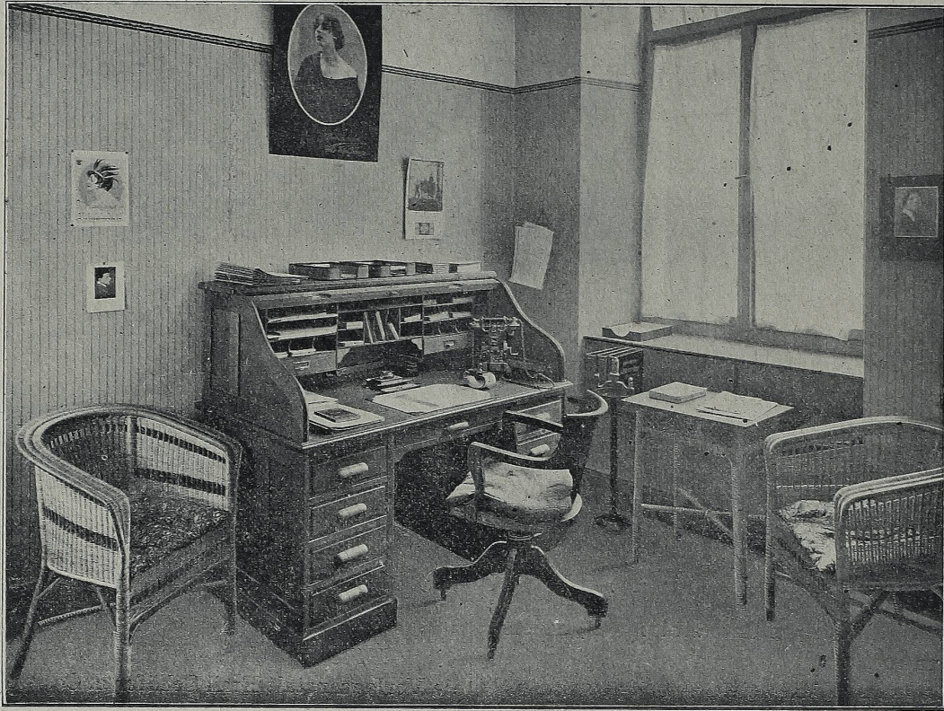
Direktions-Bureau der „Esco“ A.-G. Publicitäts-, Verlags- und Handelsgesellschaft, Zürich