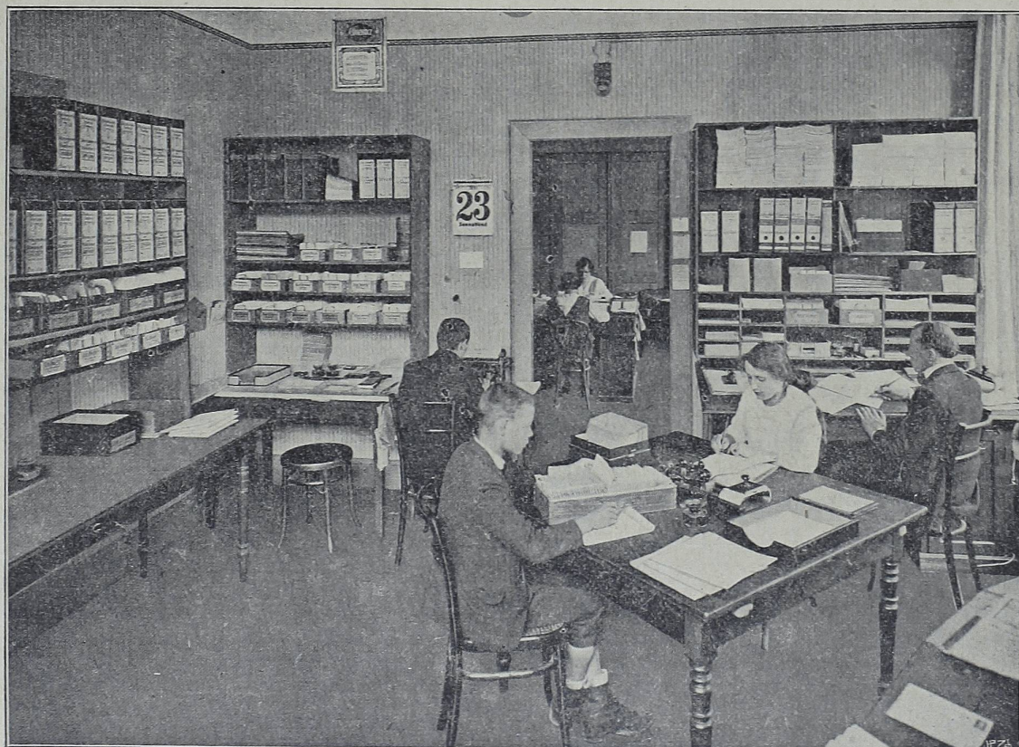
Registratur mit Blick in's Hauptbüro