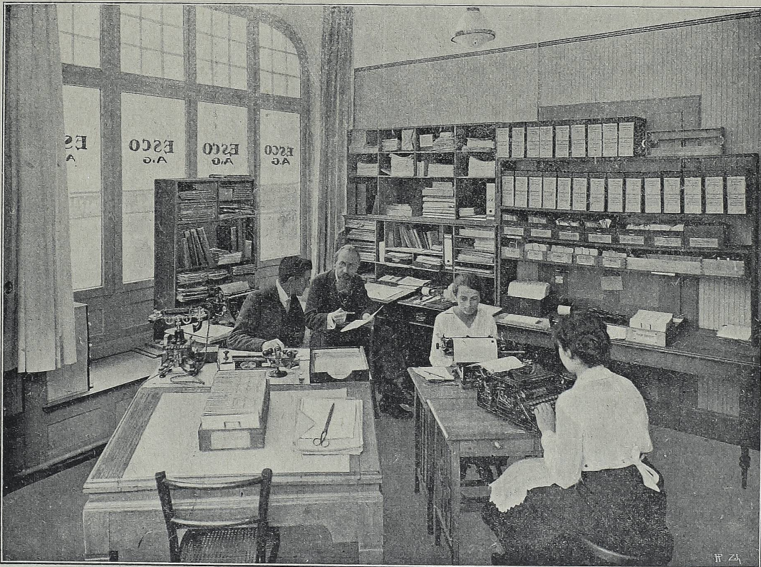
Organisation und Redaktion des „Kinema“