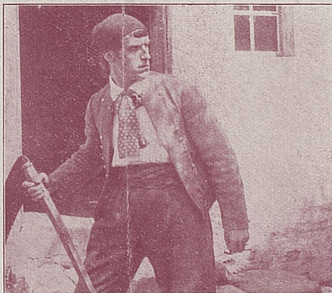
Szene aus „Die Beichte des Mönchs“

Das Filmschauspiel „Wenn das Leben ruft“, das in der Neuen Philharmonie mit