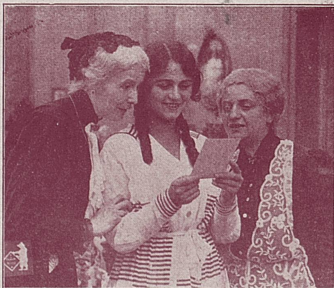
Szene aus „Wenn das Leben ruft“