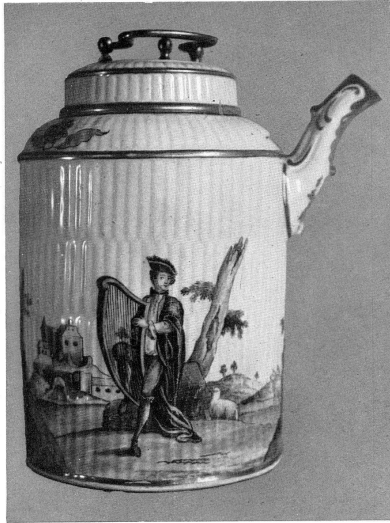
Abb. 5, Gerippte Schokoladenkanne mit der Signatur Bottengruber