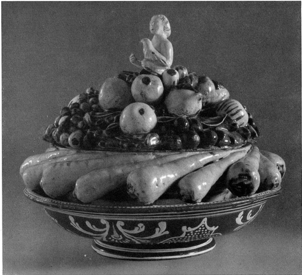
Abb. 9, Hochzeitsschüssel mit der Signatur Daniel Herrmann. Aussenseite