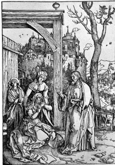
Abb. 2, Albrecht Dürer, Abschied Christi von seiner Mutter. Holzschnitt