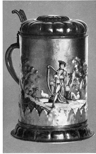
Abb. 7, Walzenkrug aus Böttger Porzellan mit der Signatur Bottengruber 1735