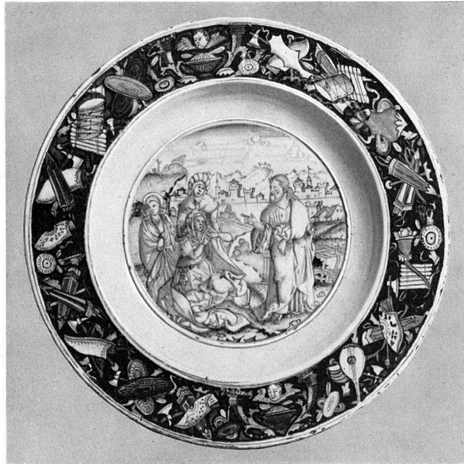
Abb. 1, Schüssel mit dem Abschied Christi von seiner Mutter, nach Dürer. Faenza um 1515