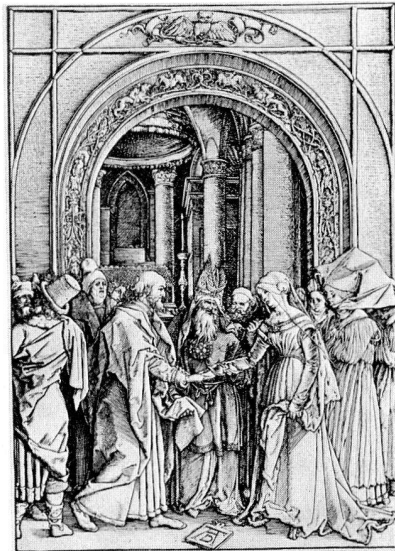
Abb. 4, Albrecht Dürer, Verlobung Maria. Holzschnitt