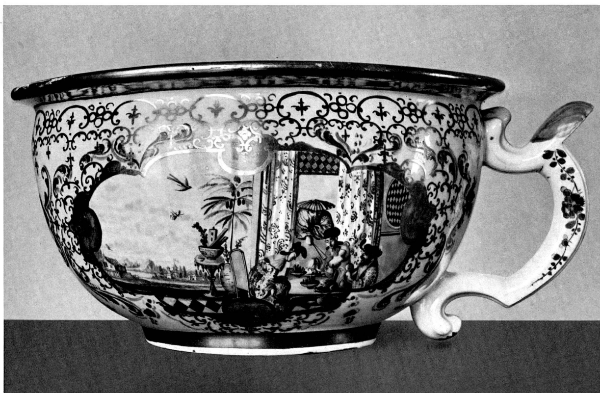
Bourdalou, Meissen, mit Chinoiserien in gold- und lüsterumrahmten Reserven. Malerei wohl von Johann Gregor Höroldt, 1724/25. Ohne Marke. Bes. Bayerisches Nationalmuseum, München.

Bulletin de la Société des Amis de la Céramique Suisse