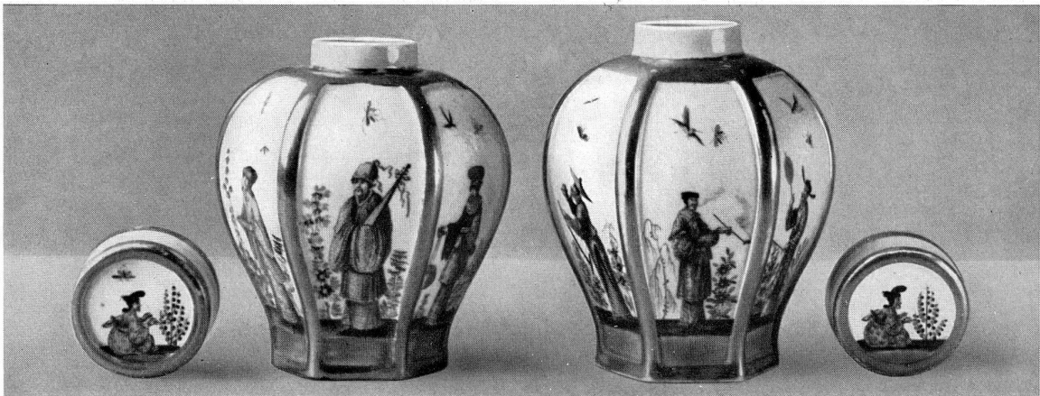
Abb. 34 Teedose rechts Pariser Fälschung, links original Höroldt-Stück.