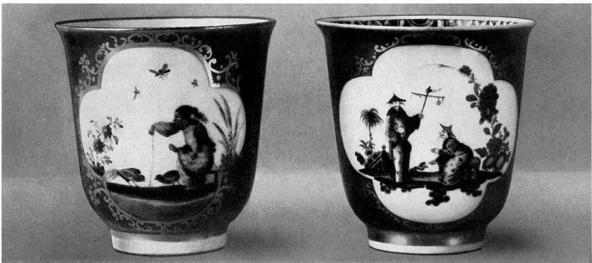
Abb. 35 Bechertasse links altes Porzellan mit gefälschter Höroldt-Malerei. Rechts echte Tasse.