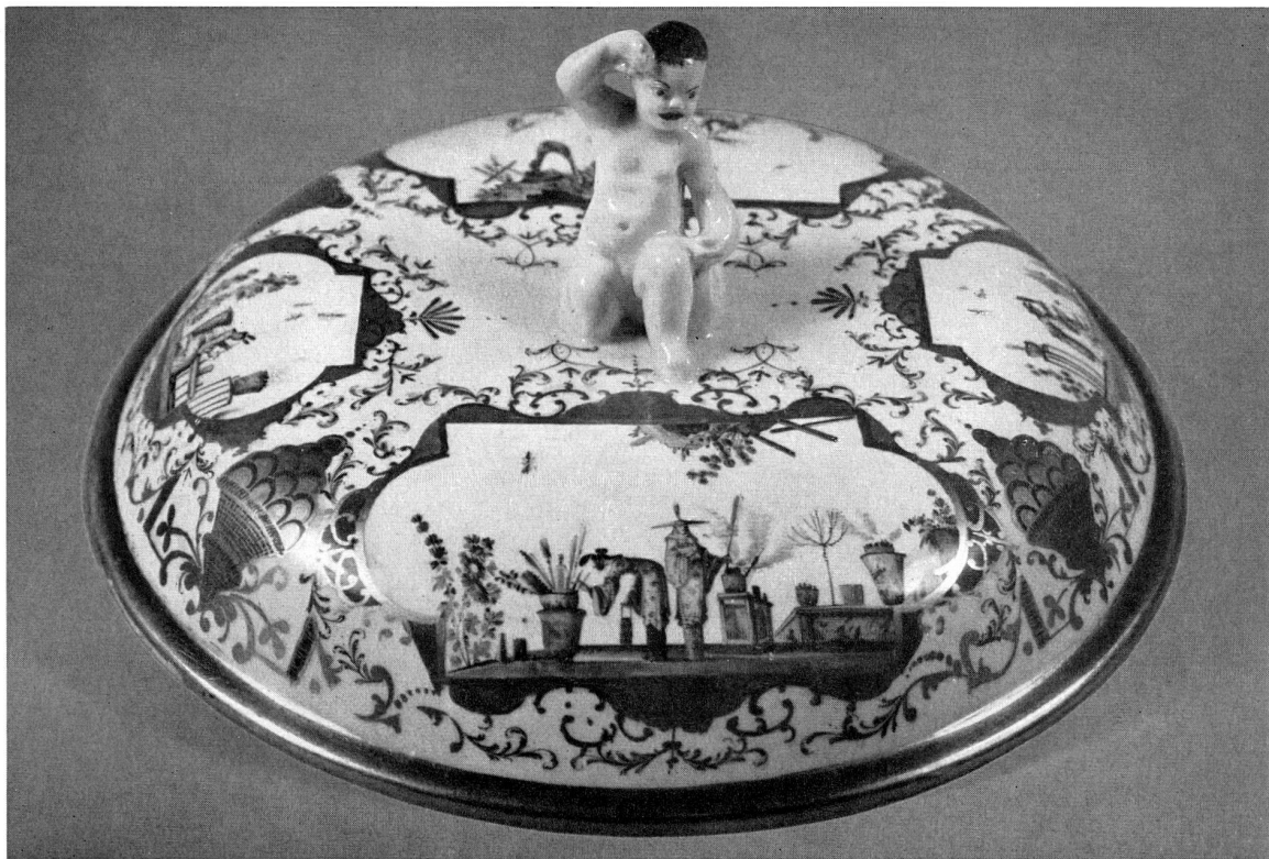
Abb. 33 Terrinendeckel mit gefälschter Höroldt-Malerei. Modernes Porzellan.