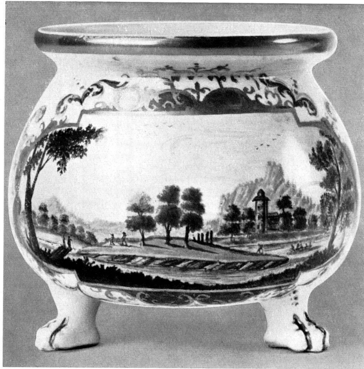
Abb. 29 Cremetopf mit früher Höroldt-Landschaftsmalerei, vorwiegend in Grün und Braun