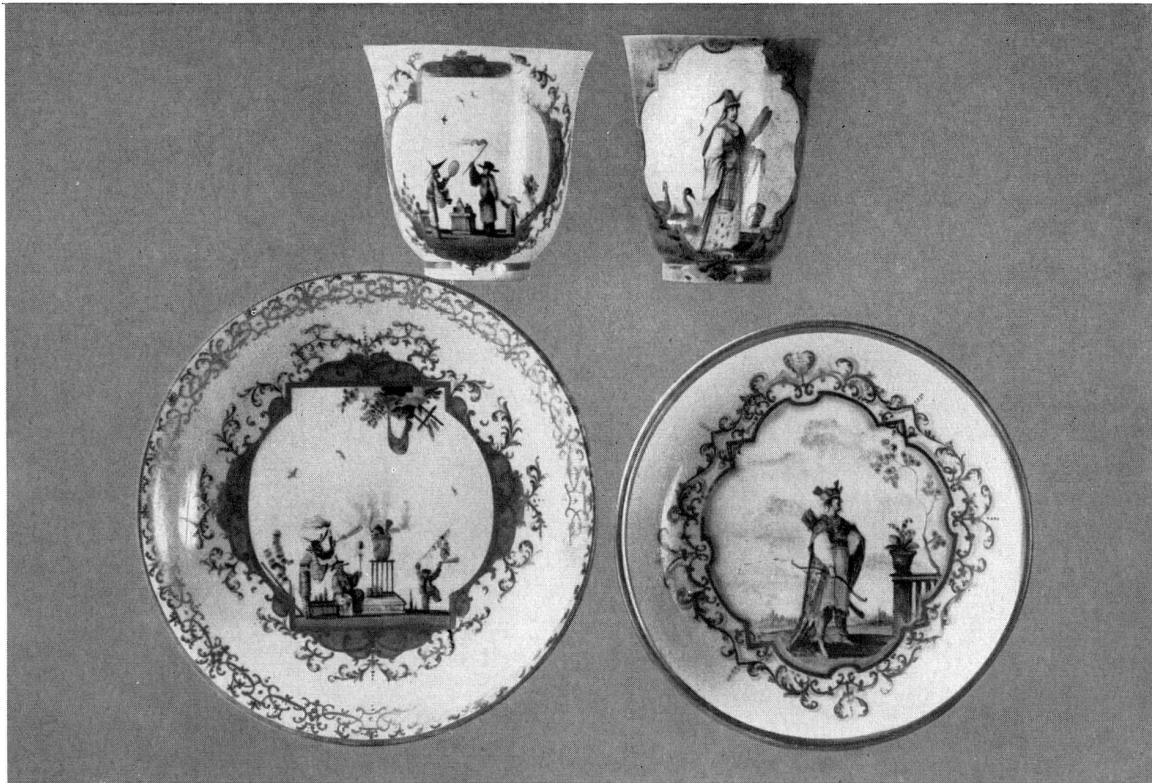
Abb. 32 Links in Porzellan und Malerei gefälschte Bechertasse. Rechts echte Tasse mit Höroldt-Malerei.