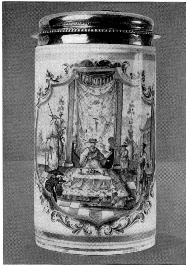
Abb. 23 Bierkrug, Höroldt-Malerei in Anlehnung an den Stich von Martin Engelbrecht, Augsburg.