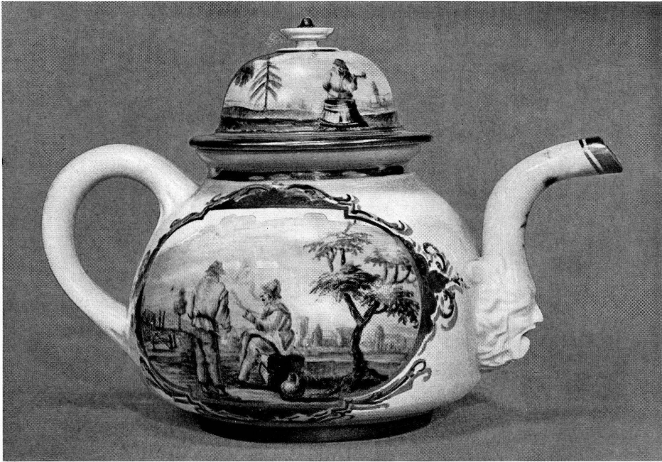
Abb. 26 Teekanne. Höroldt-Malerei im Stile David Teniers. Marke MPM.