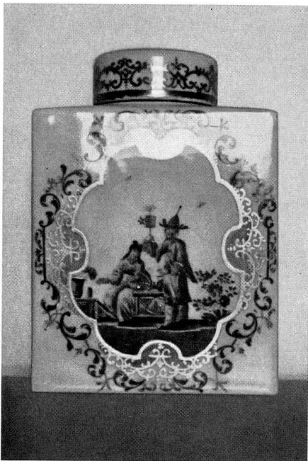
Abb. 30 Teedose, modernes Porzellan mit gefälschter Höroldt-Malerei.