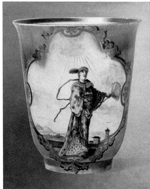
Abb. 24, Teedose mit gallefarbiger Glasur, bemalt mit Goldchinesen von Johann Gregor Höroldt. Abb. 25, Schokoladen-Becher, Höroldt-Malerei eines vornehmen Inders, die Reserve auf hellblauem Grund (Unterglasurfarbe), die Kartusche mit Gold und braunem Bandelwerk. Sonnenstrahlung im Himmel.