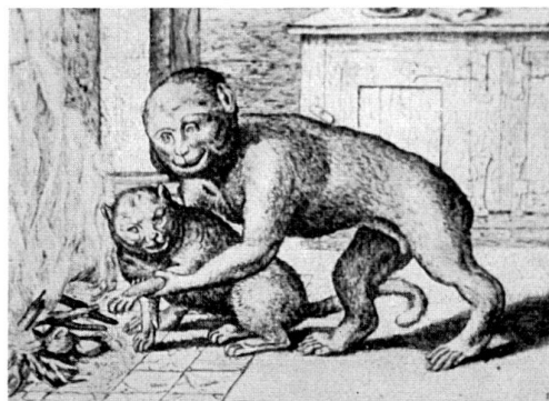
Abb. 27 Stich aus der Folge: « Volucrum pecudumque diversa genera » von Marcus Gerard, d. J. Der Stich geht zurück auf Illustrationen zu den Aesopfabeln des Marcus Gerard, d. Ä., 1567.