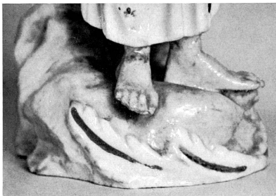
Abb. 24 Ausschnitt in stärkerer Vergrößerung aus Abb. 21. Sehr schlechte Masse und Glasur. Bemalung direkt auf das Biskuit, rudimentärer Volutensockel mit wenig Gold.