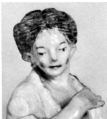
Abb. 23 Ausschnitt aus Figur Abb. 21.