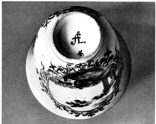
Abb. 19 Schokoladenbecher, Bemalung in Monobrom-Eisenrot. Auf beiden Teilen das Altham Monogramm in Gold. Slg. Dr. E. Schneider.