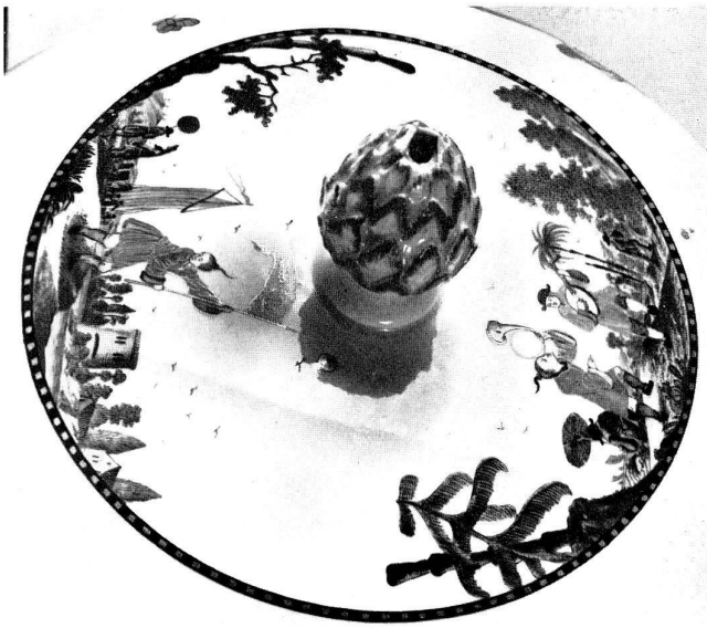
Abb. 16 Ansicht des Deckels der Terrine, Abb. 15. Auf der Fabne, die ein Chinese trägt, soll in Gold vielleicht eine Löwenfinck-Signatur zu lesen sein.