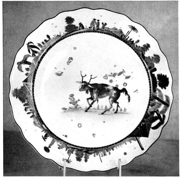
Abb. 11 Essteller aus dem Schwarz-Goldstreifen Service (Fabeltier-Service), Slg. R. H. Wark.