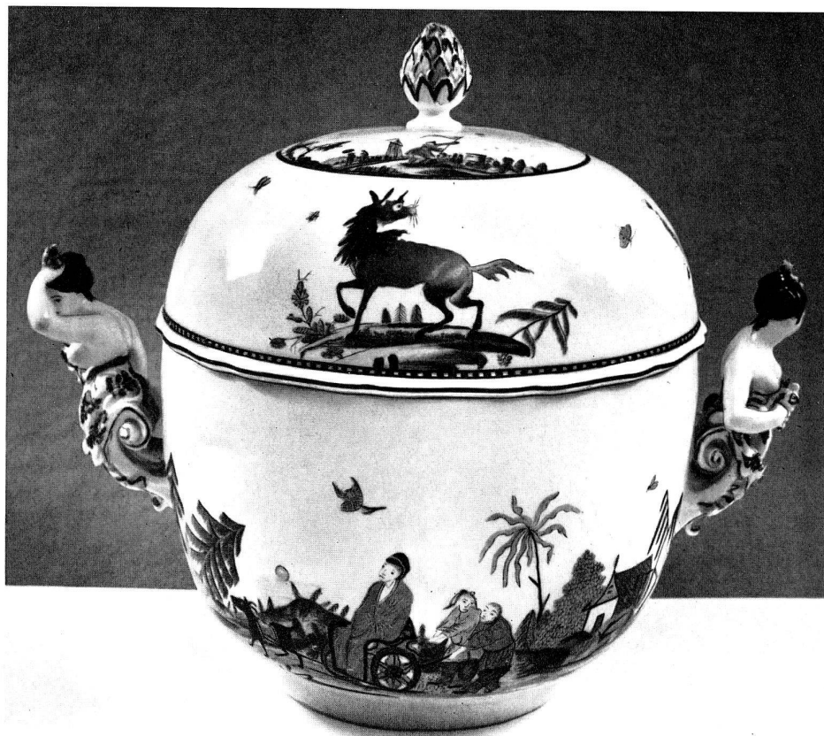
Abb. 15 Terrine, Deckel mit dem Schwarz-Goldstreifen des Fabeltier-Services. New Yorker Kunsthandel.