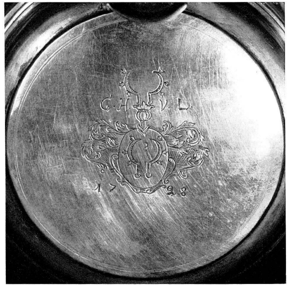
Abb. 17 Deckel des Bierkruges, Abb. 13, Silber mit eingraviertem Wapen und Buchstaben C. H. V. L. 1728.