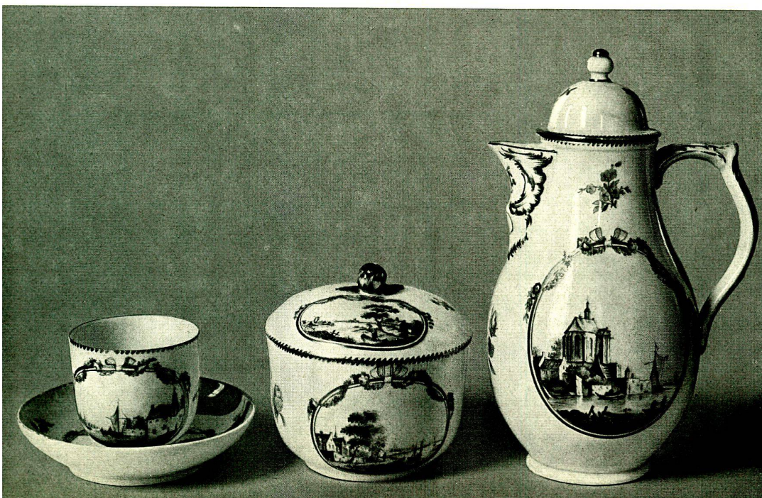
Tasse, Zuckerdose, Kaffeekanne, glatt mit Flußlandschaften Grisaille auf blaßgelbem Grund Goldene Umrahmungen mit farbigen Blumengirlanden und rosa Bandschleifen, um 1775

Der zweite Abschnitt enthält die Formgeschichte, die sich mit den schönsten deutschen Rokkoservicen, den Figuren der Brüder Friedrich Elias und Wilhelm Christian Meyer, mit den Plastiken Schadows, der Berliner Blumenmalerei, den prächtigen Dekorationen der Zeit des Wiener Kongresses befaßt, als auch die Schwierigkeiten der Periode des Historismus, die neue Blüte während des Jugendstils schildert und die durch die Industrialisierung unserer Zeit aufgetretenen Fragen der Formgestaltung behandelt.