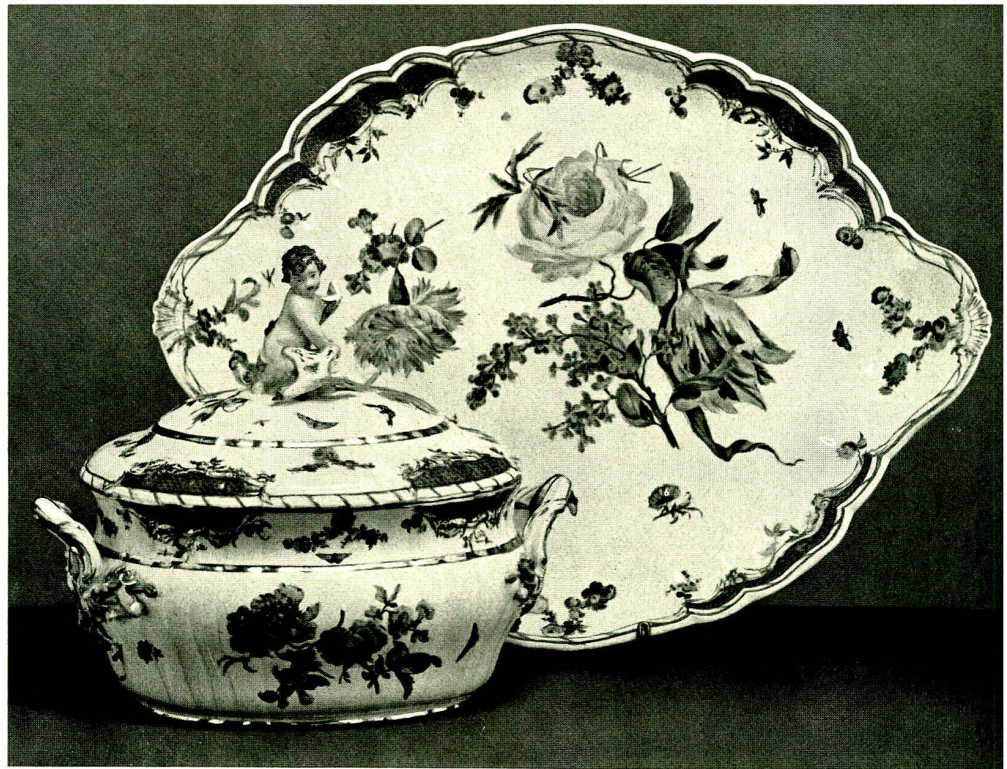
Ovale Terrine und Platte aus dem Service für das Breslauer Stadtschloß. Antikzierat mit farbiger Blumenmalerei und blauem Schuppen- mosaik 1767/68