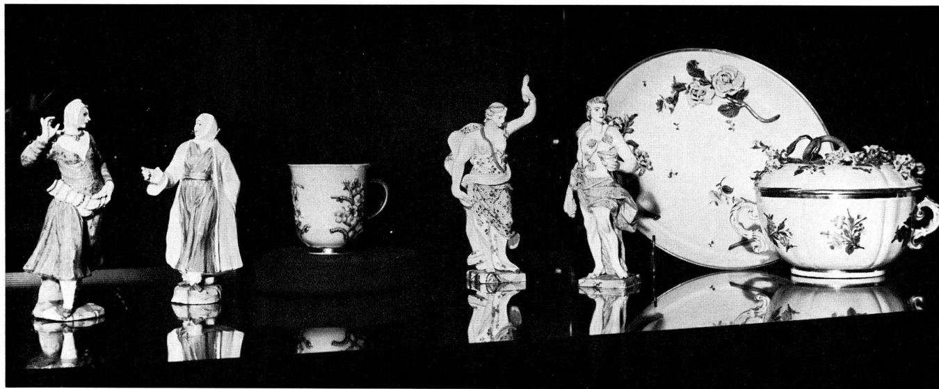
Abb. 24. Figurette policrome e tazze del II periodo della Manifattura di Doccia, 1758—1791. Museo delle porcellane di Doccia.