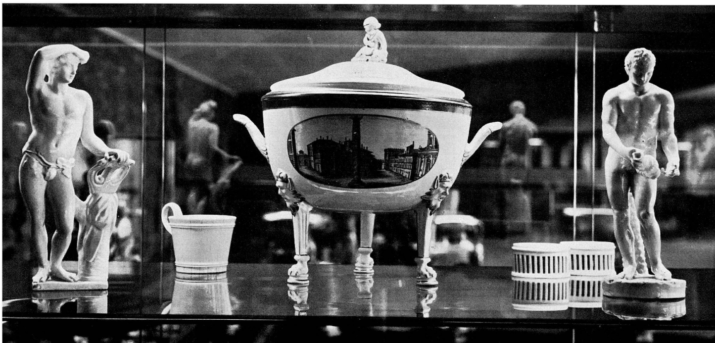
Abb. 27. Plastiche e zuppiera decorata a paese. III periodo della Manifattura di Doccia, 1792—1837. Museo della Manifattura.