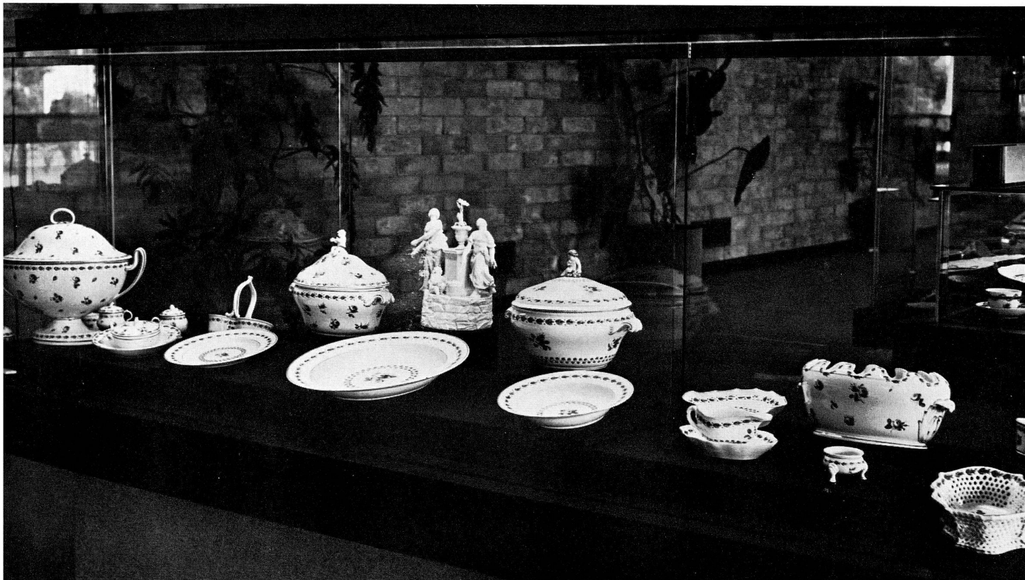
Abb. 26. Capi di servizi da tavola con decorazione a roselline e gruppo plastico di Giuseppe Bruschi. II periodo della Manifattura di Doccia, 1758—1791. Museo della Manifattura di Doccia.