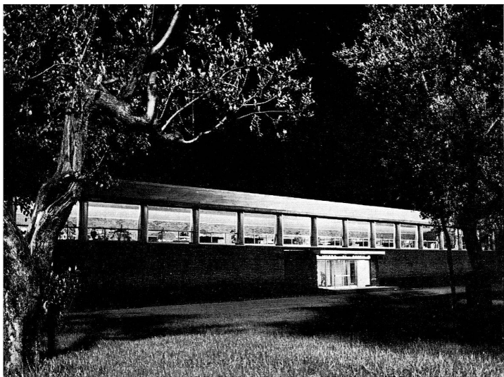
Abb. 19. L'edificio del museo di Doccia come appare alla sera, illuminato all'interno.