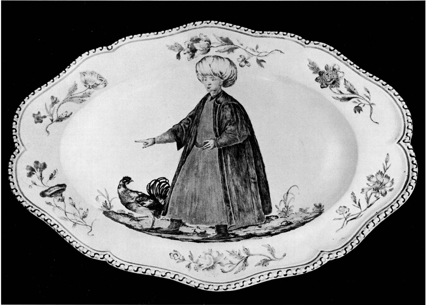
Abb. 22. Vassoio con figura di orientale dipinto da Carlo Wendelin Anreiter, I periodo della manifattura di Doccia, 1740—1745. Museo delle porcellane di Doccia.