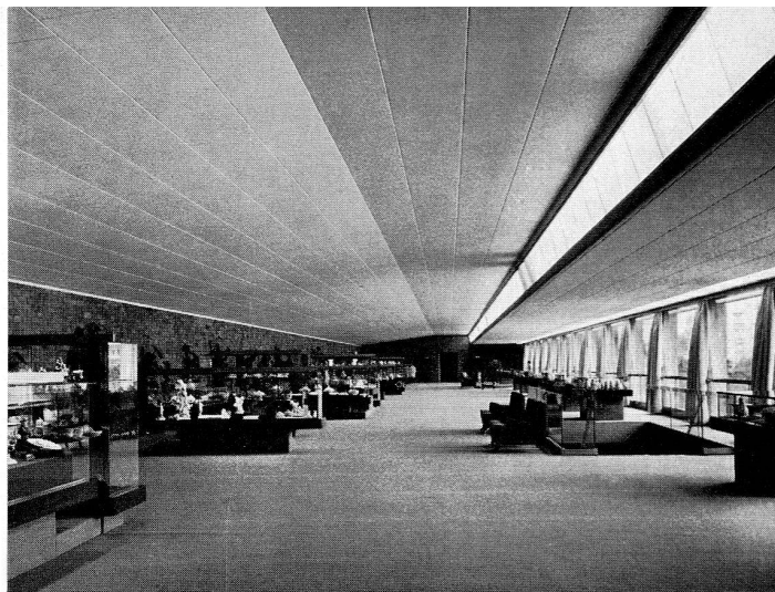
Abb. 20. Il grande salone al piano superiore del museo delle porcellane di Doccia.