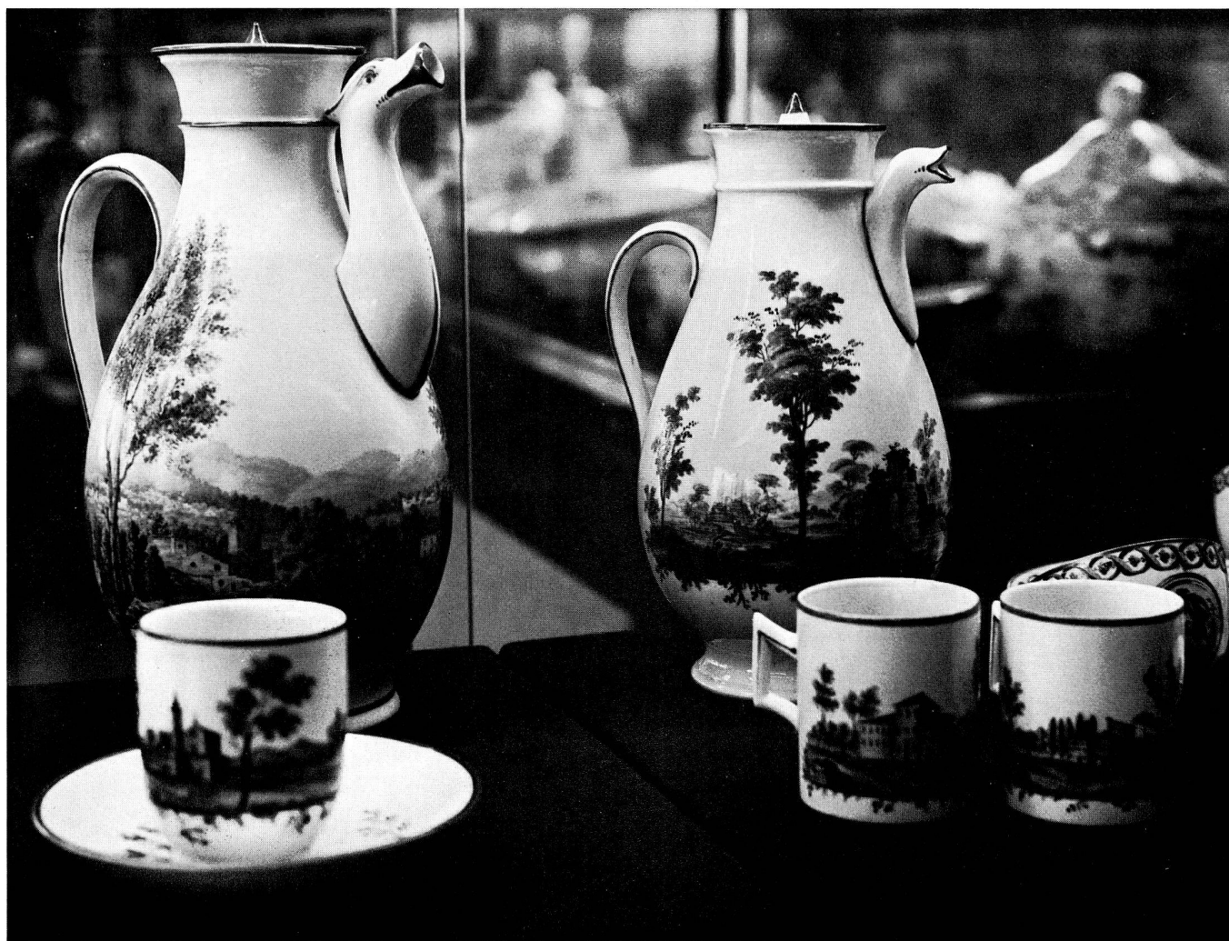
Abb. 25. Pezzi di servizi da caffè decorati a paesino policromo. Manifattura di Doccia, II periodo 1758—1791. Museo delle porcellane di Doccia.