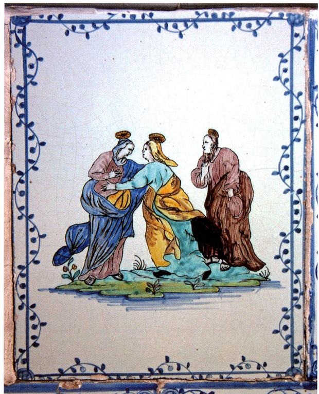
Abb 9: Visitation oder Heimsuchung (NT4), 1806. Zwei Kacheln, Freiburg, im Kloster Visitation, Freiburg, Ofen Torche, Poëles fribourgeois 191 (hier nicht im Ofen- und Bilderkatalog)