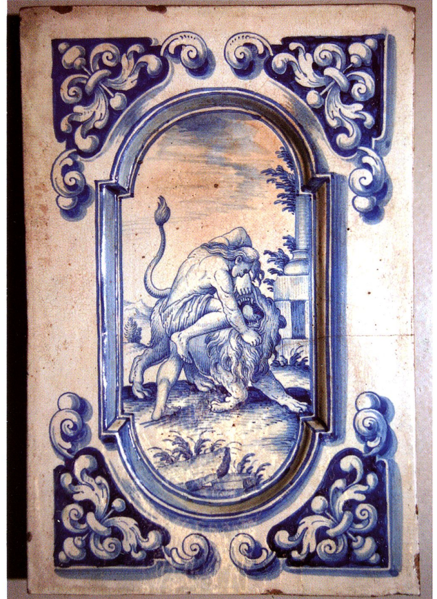
Abb. 43 Zwei Ofenkacheln, 2. H. 18. Jh. David Sulzer, Winterthur, zugeschrieben. Abrahams Knecht und Rebekka am Brunnen (AT 29). Simson und der Löwe (AT 100). Schweiz. Landesmuseum Zürich. Inv. Nr. IN 72/HA 3327, 3328

Die Steckborner Hafner übernahmen das Dekorationssystem, führten aber auch den ebenfalls vertieften rechteckigen Spiegel mit eingezogenen Ecken ein (vgl. Öfen Ofen 65 Bischofszell, 66 Warth, 72 Chur ). Auch bei den Zweipassformen verschwand im Allgemeinen gegen Mitte des 18. Jahrhunderts das Dreiblatt in den Zwickeln und machte barocken Rankenornamenten Platz. (Abb. 43)