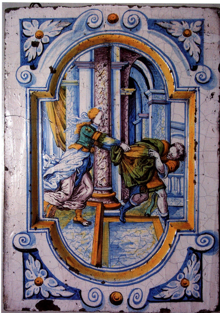
Abb. 42 Joseph und Potiphars Frau (AT 47) um 1690. Winterthurer Kachel. Schweiz. Landesmuseum Zürich. Inv. Nr. IN 103.55e

Bei den meisten frühen Beispielen sind die Umrahmungen deutlich architektonisch aufgefasst, als arkadenförmiges Portal mit seitlichen Pilastern, die von einem Kapitell abgeschlossen werden und den Bogen stützen. Die Form des Bogenportals wird neben anderen Formen noch bis ins dritte Viertel des 17. Jahrhunderts gepflegt. Wie ein reich gegliedertes Renaissancegebäude präsentiert sich der Ofenrest in Amsterdam ( Ofen 13, um 1645 ). Daneben verschwanden die glatten Füllkacheln nicht vollständig; sie wurden mit gemaltem Beschlagwerk umrahmt ( Ofen 12, Zürich Landesmuseum, um 1630 ) oder von farbigen Linien eingefasst ( Ofen 16, Lenzburg, 1665 ).