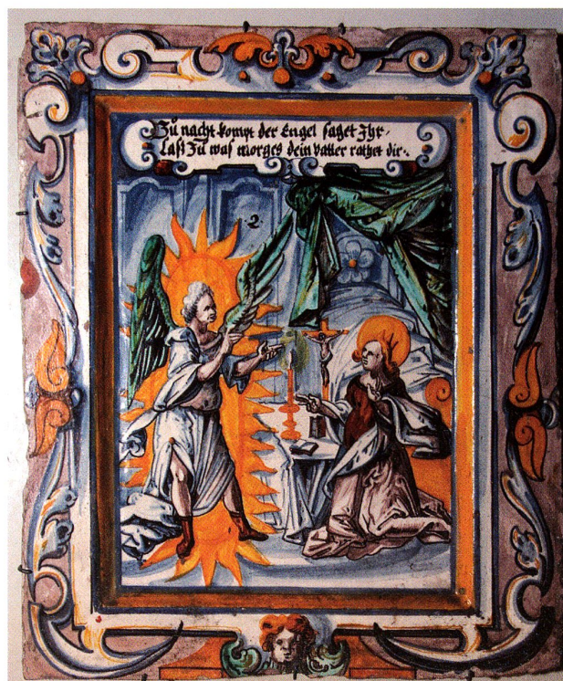
Abb. 41 Verkündigung an Maria (NT 2), um 1620. Hans Caspar Erhart, Winterthur, zugeschrieben. Schweiz. Landesmuseum Zürich. Inv. Nr. IN 6854

Im ersten Drittel des 17. Jahrhunderts liebte man dann überaus kräftige Umrahmungen. Ein typisches Beispiel ist der Ofen in Elgg 1607 ( Ofen 6 ). Hier bilden schon die grün glasierten Reliefkacheln einen starken farblichen Akzent, und die Bilder auf den Füllkacheln und den kleinen Frieskacheln unter dem Kranz sind dazu mit einer dunkelblauen Umrahmung eingefasst. Ähnliches gilt für den vollständig bunt bemalten Ofen in Luzern um 1610 ( Ofen 7 ), doch sind hier die Umrahmungen nicht einfarbig, sondern blau in blau mit Ornamenten bemalt. Bei weiteren Kachelserien nehmen die Rahmen die Farbigkeit der Bilder auf und setzen sich dadurch etwas weniger von ihnen ab. ( Abb. 41 )