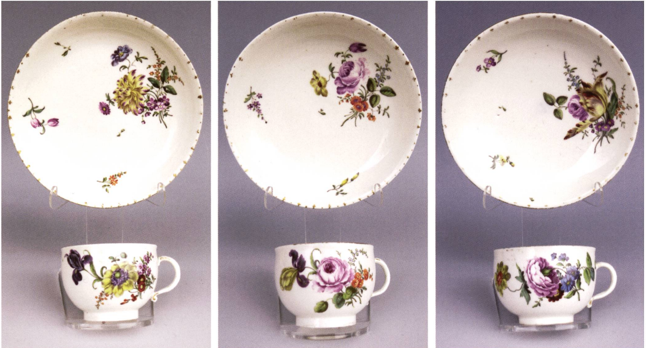
Abb. 2: Drei niedrige Tassen mit flachen Untertassen, alle mit buntem Blumenstrauß und Streublümchen wohl von Riedel; Tassen H 4,7-4,9 cm, UT Ø 13,2-13,5 cm, um 1760; Prov.: Sammlung Peter Heidelberg, Metz Heidelberg Auktion 25. März 2000, Los 152-154, Privatsammlung Stuttgart.