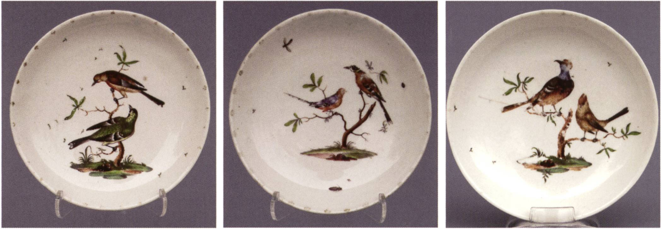
Abb. 9: Drei Untertassen in Kugeloberflächenausschnittform mit bunter Malerei mit je drei Vögel auf Baumästen, Goldspitzenrand; Ø 13,0-13,4 cm; 1760; Riedel zugeschrieben; Privatbesitz.