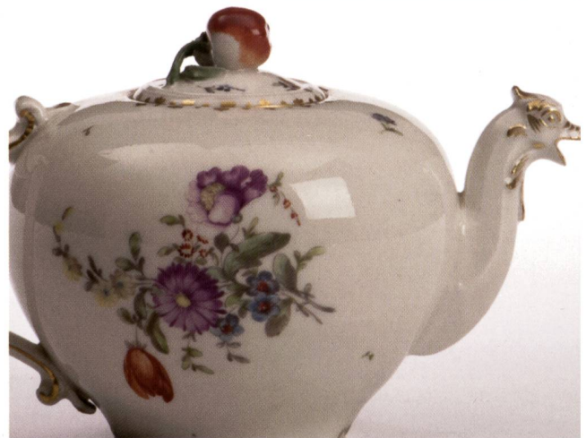
Abb. 6: Ausschnitte einer Teekanne mit Blumenstrauss, Ausguss mit Drachenkopf; H 10 cm, um 1765; © Landesmuseum Württemberg Stuttgart, Inv. Nr. WLM 14082, Landenberger (1980), S. 11 Vitr. 1 Obj. 14.

7. Fast alle hier von Landenberger vorgestellten Ringler-Malereien sind Zuschreibungen ohne erwähnte Begründungen. Sichere Argumente zu Ringlers Arbeiten fehlen bisher mit einer Ausnahme – siehe Nr. 5 – völlig, so dass sich hier schon die Frage stellt: hat Ringler überhaupt auf Porzellan gemalt? Dieser Frage folgt: wie konnte Landenberger überhaupt auf Ringler als Maler vieler Blumenmalereien kommen, wo doch hierfür eine grundlegende, feste Bestimmung, am sichersten durch eine Signatur oder aber andere Grundlagen, notwendig wäre? Als Begründung all ihrer Annahmen hat Landenberger nur eine vorgenommen: Sie hat den Stil der Zeichnungen in den Arkanabüchern (siehe unten) verglichen mit Malereien auf Porzellan, die sie entsprechend Ringler zuschrieb, weil sie basierend auf Ducrets Veröffentlichungen Ringler diese Zeichnungen zuschrieb. Auch hierzu unten Näheres.