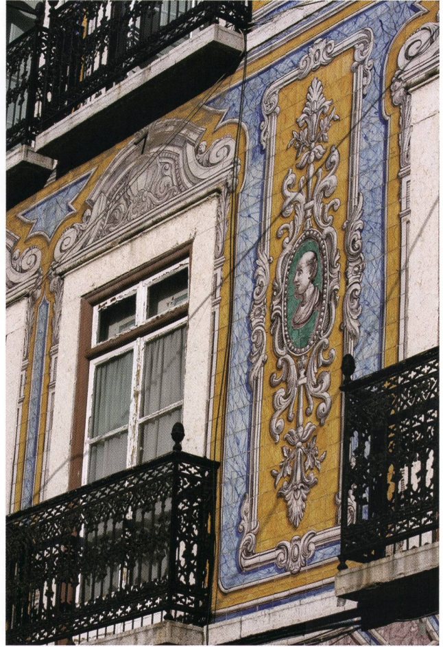
Azulejos verfolgten uns auf Schritt und Tritt in der pittoresken Altstadt von Lissabon.

Gängen auf und vermittelten den Gästen einen guten Einblick in diese einzigartige Ausdrucksform der Saudade, dem portugiesischen Lebensgefühl geprägt von Trauer, Sehnsucht und Schmerz.