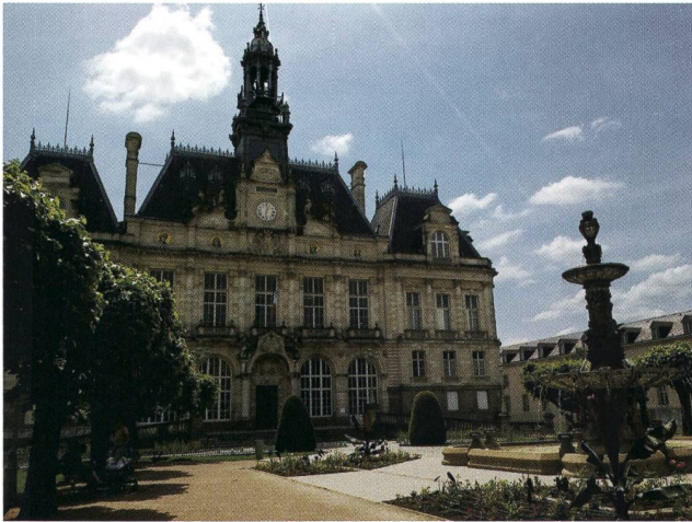
Limoges – Hotel De Ville.