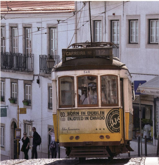
Tram in der Altstadt von Lissabon.

Fünf Tage bei strahlendem Sonnenschein und mit sommerlichen Temperaturen bescherte Lissabon den 15 Keramikfreunden. Am ersten Reisetag traf sich die Gruppe, die teilweise individuell angereist war, auf der Dachterrasse unseres Hotels Do Chiado mitten im Stadtzentrum mit wunderbarem Blick auf die Burg, die Lissaboner Altstadt und den Tejo-Fluss. Nach einem kurzen historischen Überblick über die wechselhafte Geschichte Portugals durch die Reiseleiterin erkundeten die Keramikfreunde die nach dem Erdbeben von 1755 erbauten Stadtteile, bevor wir das Abendessen in einem typischen Fado-restaurant genossen. Verschiedene Sänger und Sängerinnen traten zwischen den