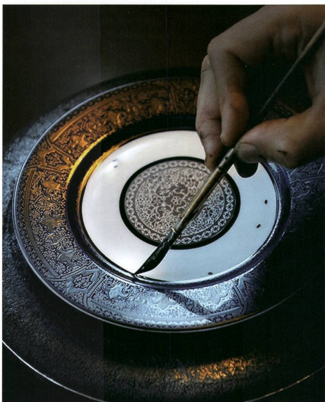
Manufacture Haviland

Le matin, également hors programme, visite du cimetière de Louyat, un des plus grands de France, avec notamment ses plaques de porcelaine sur les pierres tombales ainsi que les sépultures d'Adrien Dubouché et de la famille Haviland. Ensuite, visite passionnante du Musée des beaux-arts dont nous avons pu admirer la fantastique collection d'émaux de Limoges sous la conduite d'un guide. L'ensemble comprend non seulement les somptueux émaux du Moyen Âge et de la Renaissance, mais également des productions du XIX e et du XX e siècle. Située à quelques pas du musée, la cathédrale Saint-Etienne (dont la construction débuta en 1273) se distingue notamment par son splendide jubé de la Renaissance (déplacé et remonté ultérieurement).