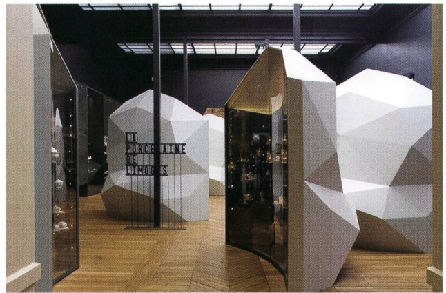
Musée Adrien-Dubouché.