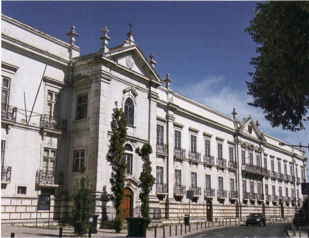
Der prächtige Convento da Madre de Deus in welchem das Nationale Azulejomuseum untergebracht ist.

herzustellen. Unter anderem wurden uns die verschiedenen Einlegetechniken demonstriert. Wir konnten Handwerkern bei der Prägung von Ledereinbänden für Bücher über die Schultern gucken. Eindrücklich wurde uns die Herstellung von Kopien historischer Möbelbeschläge sowie die Produktion der dafür notwendigen Werkzeuge erläutert. Diese einzigartigen Werkstätten nehmen Aufträge von Privaten, aber auch Museen entgegen und tragen zur Erhaltung und Ausbildung in alten Techniken bei.