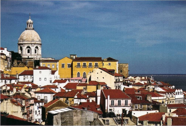
Altstadt von Lissabon hoch über dem Tejo.

Fünf Tage bei strahlendem Sonnenschein und mit sommerlichen Temperaturen bescherte Lissabon den 15 Keramikfreunden. Am ersten Reisetag traf sich die Gruppe, die teilweise individuell angereist war, auf der Dachterrasse unseres Hotels Do Chiado mitten im Stadtzentrum mit wunderbarem Blick auf die Burg, die Lissaboner Altstadt und den Tejo-Fluss. Nach einem kurzen historischen Überblick über die wechselhafte Geschichte Portugals durch die Reiseleiterin erkundeten die Keramikfreunde die nach dem Erdbeben von 1755 erbauten Stadtteile, bevor wir das Abendessen in einem typischen Fado-restaurant genossen. Verschiedene Sänger und Sängerinnen traten zwischen den