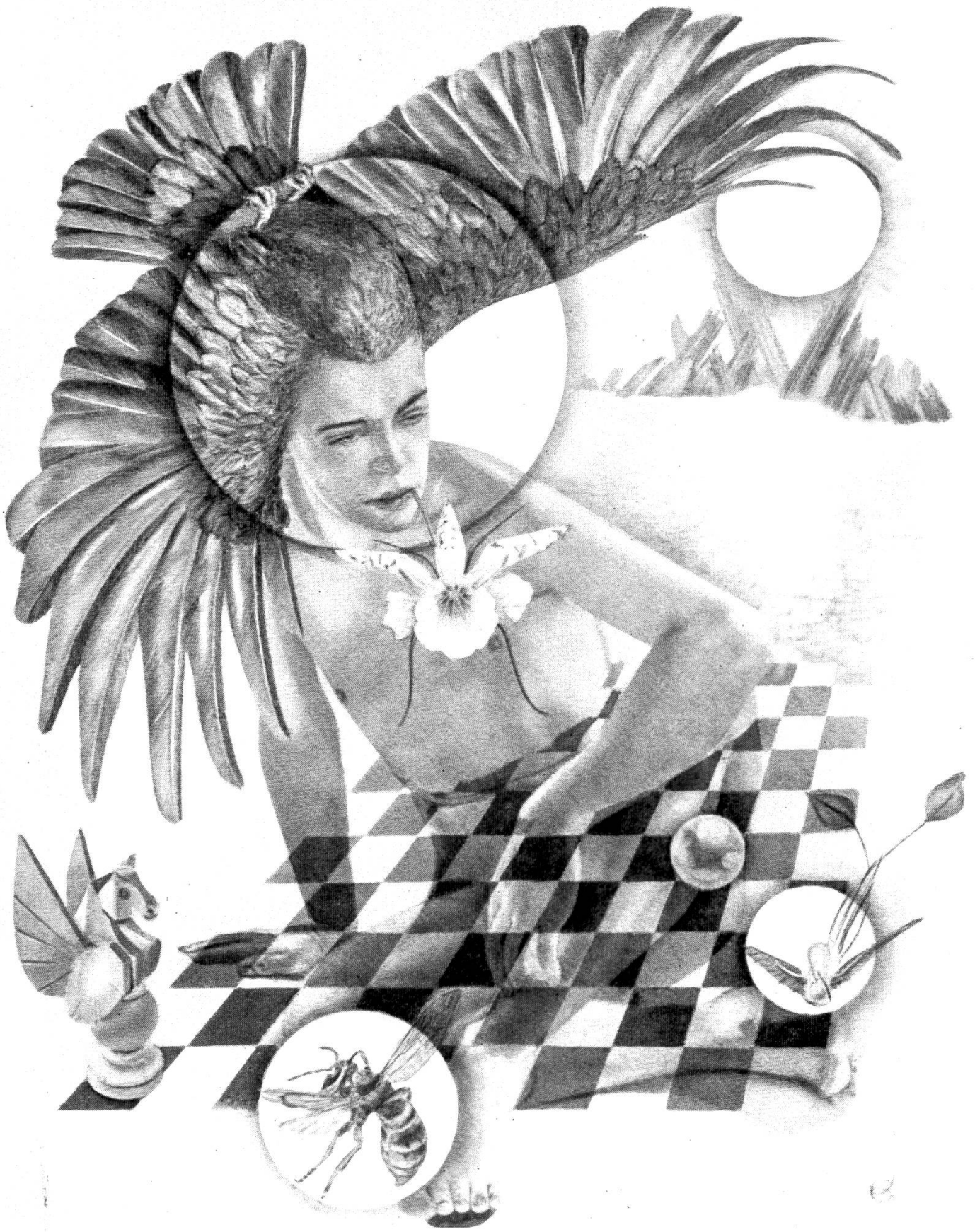
Dessin de Czanara, Paris

Reproduit du livre «L'homme, par le dessin»