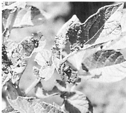
Kartoffelkäfer findet man häufig zuerst auf viruskranken Stauden.