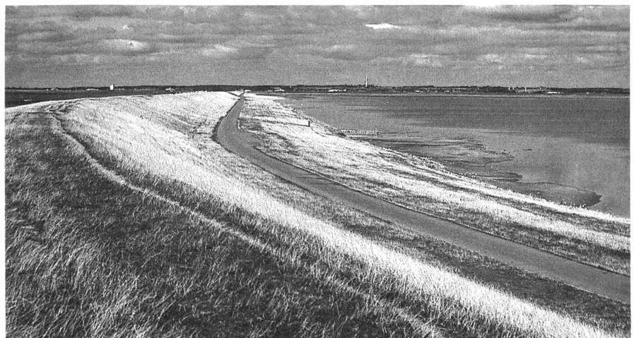
Hohe Deiche schützen das dahinter liegende Kulturland.

Ein Teil der Felder, die zum Stienkenhof gehören, liegt auf Meeresniveau. Wie in Holland sind auch in Schleswig-Holstein grosse Flächen dem Meer abgerungen worden und sind durch hohe Deiche gegen Sturmfluten geschützt. Für den Besucher aus dem Hügelland ist das eine eigenartige Vorstellung, dass bei Sturmflut die Felder unter Umständen mehrere Meter unter dem Wasserspiegel liegen... sr.