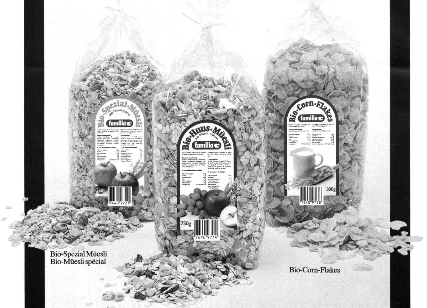
Bio-Spezial Müesli Bio-Müesli spécial

beaucoup des matières premières biologiques, emballage simple