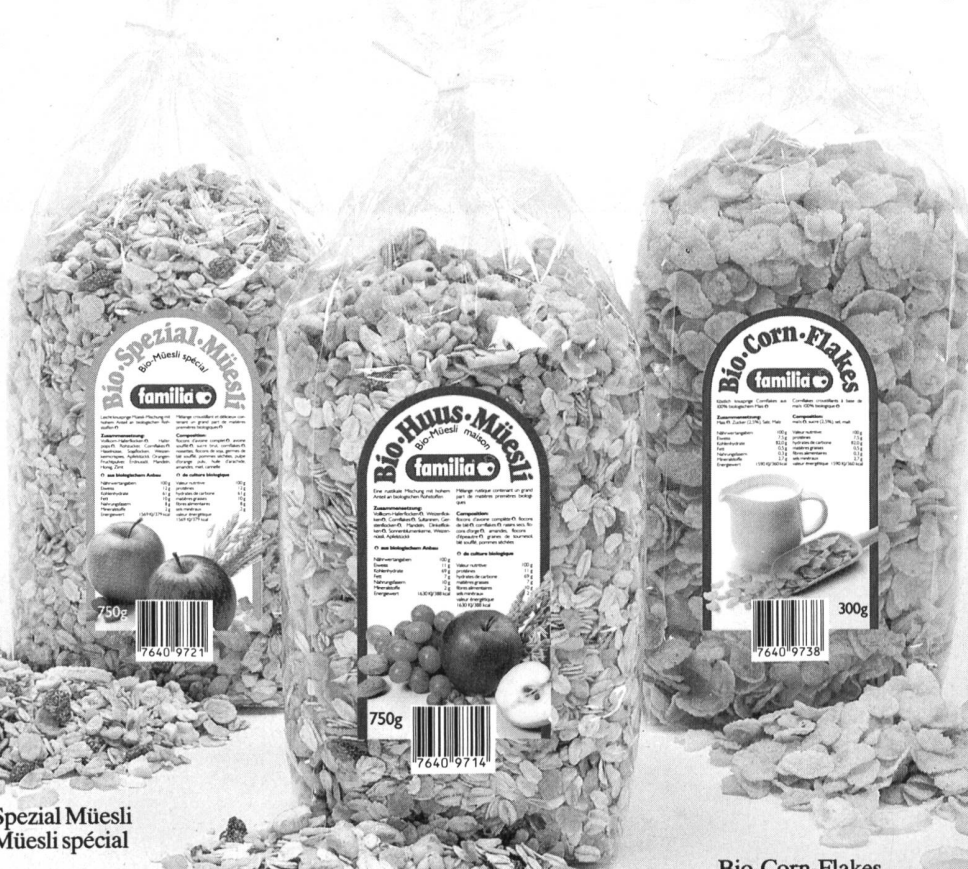
Bio-Spezial Müesli Bio-Müesli spécial

beaucoup des matières premières biologiques, emballage simple